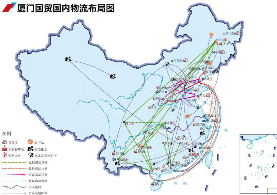
厦门国贸国内物流布局图

公司不断加强物流资源的投资布局，采取轻/重资产相结合，与属地企业合资合作的模式，自管仓库面积 100 余万平方米、合作仓库超 2,500 个，配送平台覆盖国内沿海及内陆主要区域，具有全面的综合运输和配送服务保障能力。公司现自有大型远洋船舶 6 艘、自有运力 45.5 万吨，管理船舶 25 艘、管理运力 157 万吨，年海运运输量超 3,000 万吨；自有 2 艘万吨级江船，自有船和外协船江运年运输量超千万吨。公司在印尼、新加坡、几内亚等地投资布局关键物流核心资产，自有 30 万吨级超大型浮仓 1 艘，经营管理拖轮 15 艘、驳船 18 艘，持续加强国际物流服务能力。